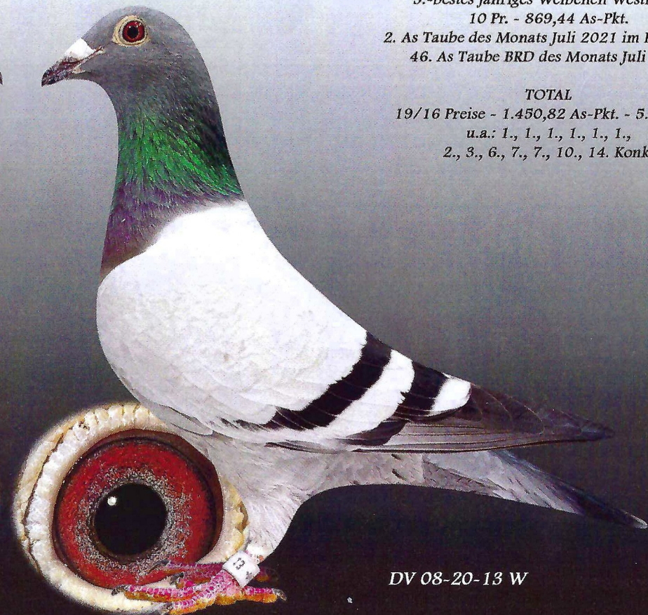
DV 08-20-13 W